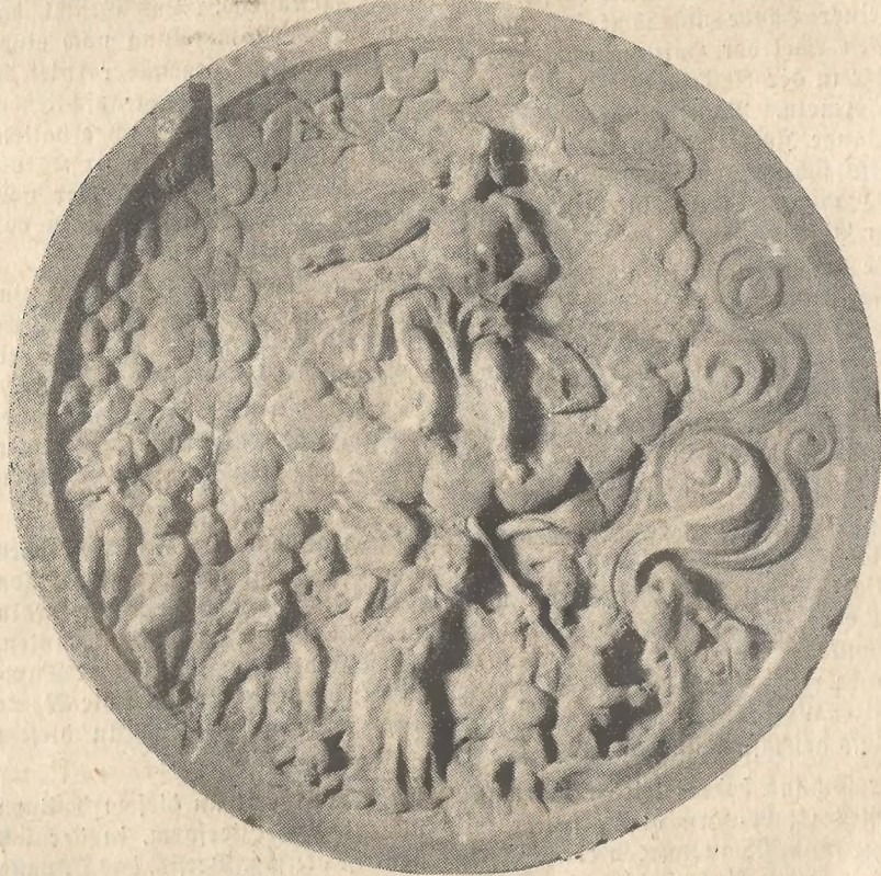
Abb. 3 Jüngstes Gericht vom Meyllenschen Epitaph. Städt. Altertumsammlung Gmünd.